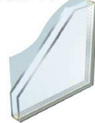
冬場の暖房効果UP 夏場の冷房効果UP