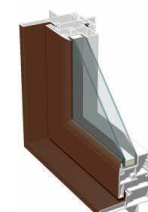
外観/ブラウン色 内観/ホワイト色