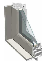
外観/プラチナステン色 内観/ホワイト色