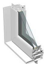
外観/ホワイト色 内観/ホワイト色